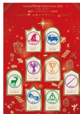
▲スタンプラリー台紙イメージ