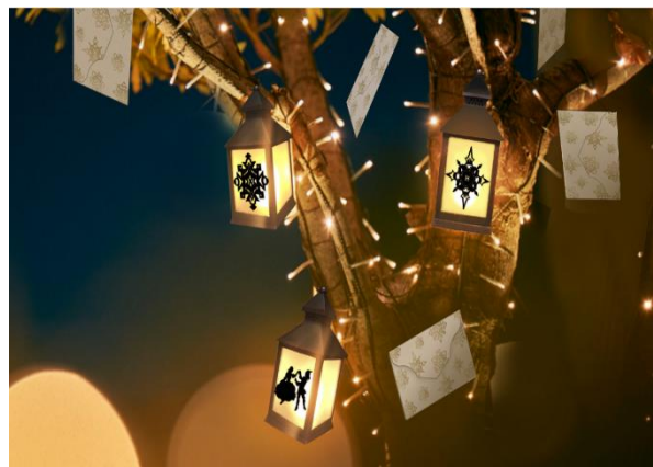
▲「ハリー・ポッター」モチーフの特別装飾イメージ

JR 大阪駅前に広がる約 1ha におよぶ「うめきた広場」の周辺やけやき並木、北館西側歩道の樹木 94 本にシャンパンゴールド色の LED 約 33 万球が上品に光り輝きます。