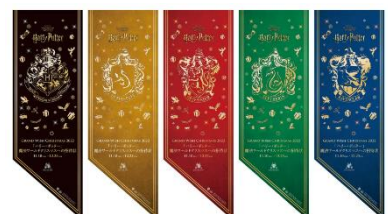
各所に「ハリー・ポッター」魔法ワールドモチーフの装飾が登場！

※新型コロナウイルス感染拡大の状況等により、本イベント内容は一部変更、または中止となる可能性がございます。