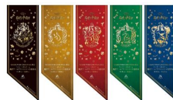
▲フラッグ装飾イメージ