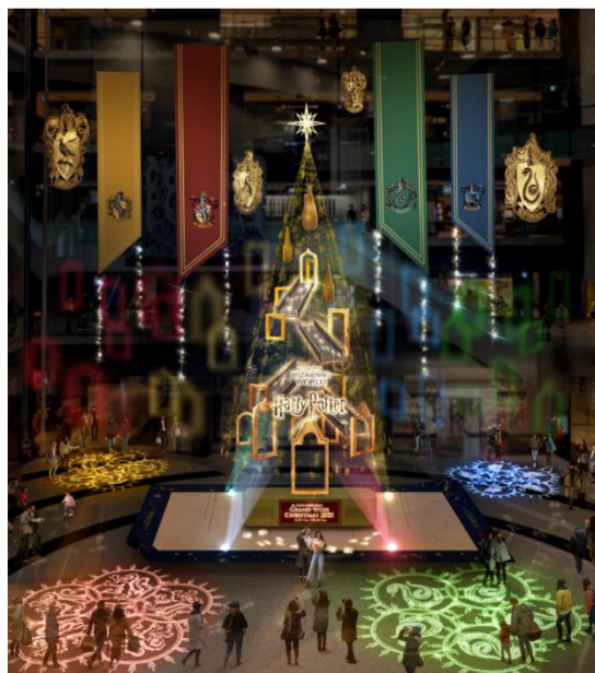
▲演出時のイメージ

「ハリー・ポッター」魔法ワールドの物語に登場するモチーフが各所に散りばめられた約13mのメインクリスマスツリー『Floating Magic Tree 浮遊する魔法の樹』がナレッジプラザに登場。