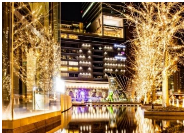
▲過去のシャンパンゴールドイルミネーションの様子