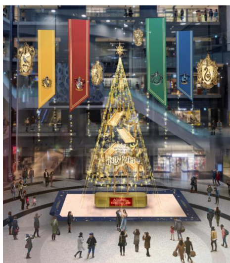
メインクリスマスツリー 『Floating Magic Tree 浮遊する魔法の樹』