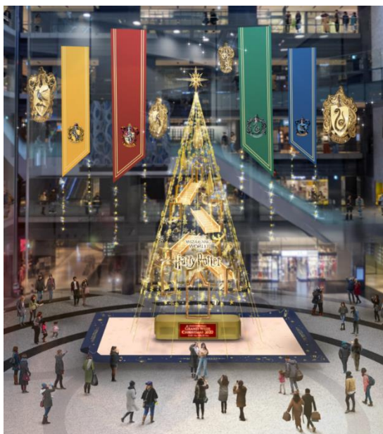
▲通常時のイメージ